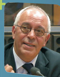
David Justino - Presidente do Conselho Nacional de Educação "Alteração do Modelo de Avaliação"