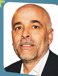
Jorge Ascensão - Presidente da CONFAP (Confederação Nacional da Associação de Pais) "A importância do Envolvimento dos Pais Encarregados de Educação no acompanhamento das Tarefas Escolares dos Alunos e em todo o processo de ensino e aprendizagens"