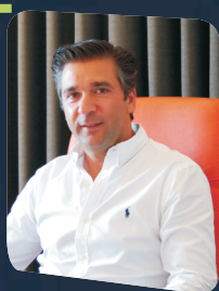
Rui Ventura - Presidente da Câmara Municipal de Pinhel Sessão de Abertura